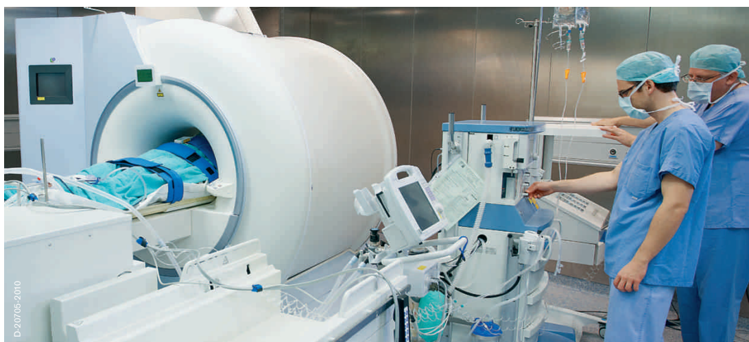
Нейрохирургический комплекс системы для МРТ и операционной Фаза поддержания анестезии. Мониторинг пациентов во время процедуры МРТ (оборудование для анестезии, монитор пациента, шприцевые насосы)