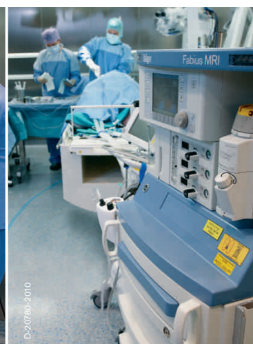
Фаза поддержания анестезии Применение Fabius MRI во время нейрохирургического вмешательства.