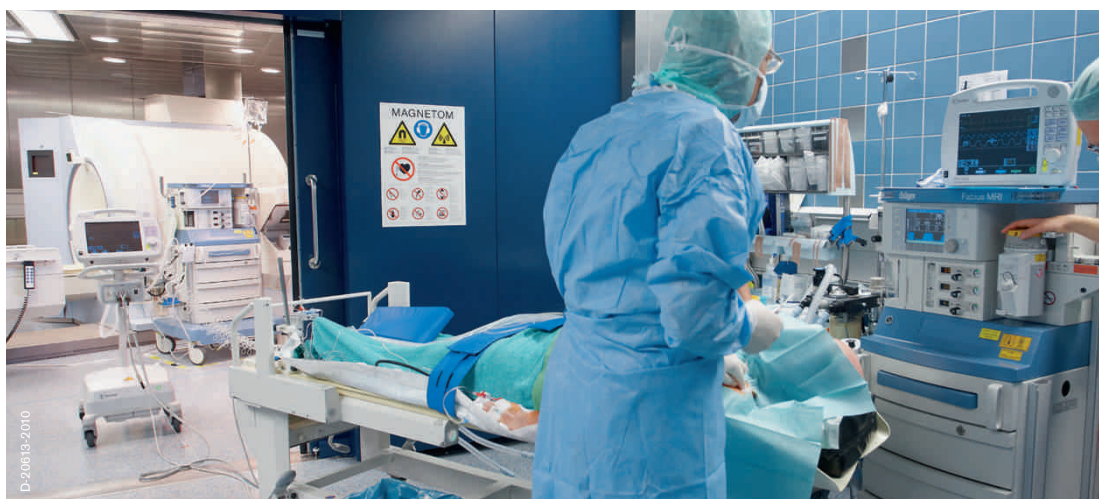
Палата предварительного обследования

Применение анестезии у пациентов перед поступлением в нейрохирургическую операционную с МРТ